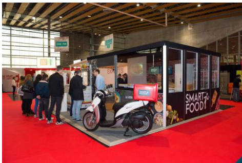
SMART FOOD by CITC

Hologramme, vitrine connectée, talon personnalisé imprimé en 3D, coach déco virtuel, chatbot... l'espace innovation a une fois encore attiré tous les regards. Autre rendez-vous incontournable du salon : le Smart Food by CITC (Centre d'Innovation des Technologies Sans Contact) qui proposait de découvrir différentes innovations autour du restaurant connecté.