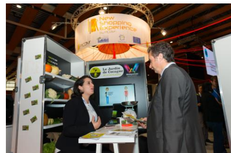
NSE by PICOM

Sur une surface de 600 m 2 , l'espace innovation, soutenu par le Conseil Régional des Hauts-de-France et la Métropole Européenne de Lille (MEL), a proposé aux visiteurs de découvrir les startups innovantes du Connected Innovation Village porté par le Pôle Ubiquitaire – EuraTechnologies et les projets innovants des PME de New Shopping Expérience 2016, by PICOM.