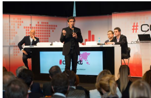
Keynote Data – Quality & Creativity – Raphaël Enthoven